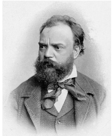
Antonín Dvořák

In der Tat beschritt Dvořák mit seiner achten Sinfonie, auf die er hier anspielt, neue Wege. Bisher hatte er sich an seinem Vorbild Johannes Brahms orientiert und an dessen klar strukturiertem klassischen Formenkanon. Mit der achten Sinfonie aber scheint er all dies über Bord werfen zu wollen. Das Schema der klassischen Sonatensatzform wird sehr frei gehandhabt; in den Vordergrund tritt statt dessen das melodische Element mit seinem folkloristisch getönten Material, wobei Dvořák es versteht, die Formen, Farben und das Flair der böhmischen Volksmusik einzufangen, ohne diese konkret zu zitieren. Der volkstümlich-pastorale Charakter der achten Sinfonie ist unüberhörbar, und es war wohl nicht zuletzt die geliebte "Sommerresidenz" Vysocká, ein alter Schafstall, den Dvořák für wenig Geld erworben und zum Refugium ausgebaut hatte und der für den Komponisten in den folgenden Jahren zum Quell künstlerischer Inspiration wurde. Ausführlich beschrieb er in seinen Briefen die Eindrücke und Empfindungen, die er von seinen Spaziergängen durch die Natur nach Hause brachte