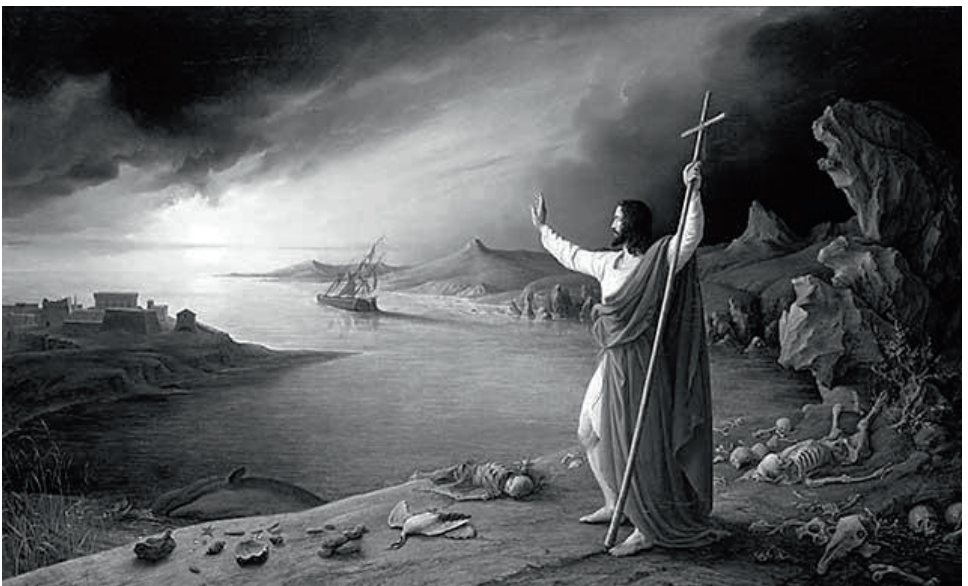
Apocalypse, Gemälde von Ludwig Ferdinand Schnorr von Carolsfeld, 1831