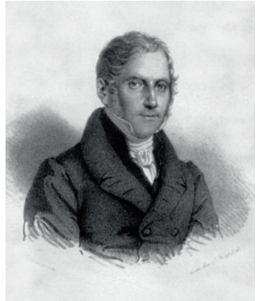
Louis Spohr, Lithographie von Joseph Kriehuber um 1850

Am Karfreitag des Jahres 1826 brachte Spohr mit dem von ihm gegründeten Cäcilienverein „Die letzten Dinge“ in der Kasseler Martinskirche zur Uraufführung. Spohr berichtet in seinen „Lebenserinnerungen“ darüber: „Ein vierzehn Fuß langes, mit 600 Glaslampen behängtes Kreuz, schwebte in der Mitte der Kirche und verbreitete ein so helles Licht, daß man allenthalben die Textbücher lesen konnte, das Orchester- und Sängerpersonal, beinahe 200 Personen stark, war auf der Emporkirche terrassenförmig aufgestellt und den Zuhörern unsichtbar.“ So groß wie der Aufwand, den Spohr hier beschreibt, war auch der Erfolg des Werkes, was sicher auch damit zu tun hatte, dass es Spohr mit