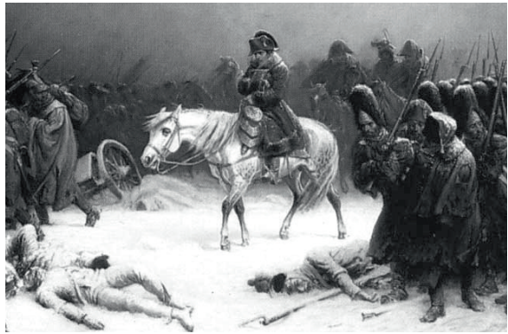
„Napoleons Rückzug aus Moskau“, Öl auf Leinwand von Adolphe Northen (via wikimedia commons)

Russlandfeldzug 1812 war in der Tat apokalyptisch und in seiner Grausamkeit unvorstellbar. Man geht heute davon aus, dass allein dabei eine Million Menschen ihr Leben ließen und fast alle eingesetzten Pferde, ungefähr 200.000 an der Zahl, in den Weiten Russlands umkamen. Die in großen Teilen Europas vorherrschende tiefgreifende Erschütterung angesichts der verheerenden Kriege verarbeiteten viele Künstler dieser