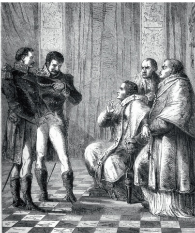
Pope Pius VII. arrested by the order of Napoleon Buonaparte in John Cassell: Cassell's Illustrated History of England, Vol. 6

„Die letzten Dinge“ ist das zweite von insgesamt vier von Spohr komponierten Weltgerichtsoratorien. Auch andere Komponisten dieser Zeit beschäftigten sich in ihren Kompositionen mit der Apokalypse. Um die Entstehungsgeschichte dieser Werke, und damit auch die des Oratoriums „Die letzten Dinge“ verstehen zu können, muss man die Epoche betrachten, in der sie entstanden.