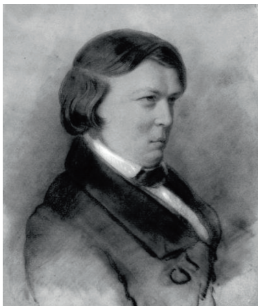
Robert Schumann Zeichnung von Jean Joseph Bonaventure Laurens, 1853

Am 2. September 1850, an einem Montag um 19 Uhr, erreichten Clara und Robert Schumann mit ihren Kindern den Köln-Mindener Bahnhof in Düsseldorf. Ferdinand Hiller und das Konzertdirektorium der Stadt Düsseldorf erwarteten die neuen Mitbürger. Die Hotelzimmer im Breidenbacher Hof waren mit Blumen geschmückt, eine “Liedertafel” brachte den Ankömmlingen ein Ständchen und am folgenden Samstag wurde Schumann in einem großen Festakt als Städtischer Musikdirektor willkommen geheißen.