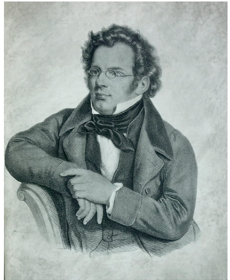
Franz Schubert, Lithographie von C. Helfert “Die berühmten Musiker”, Kunstverlag Lucien Mazenod, Genf 1946

Später setzte Schubert diese Ouvertüre zur “Zauberharfe” als Ouvertüre zum Schauspiel “Rosamunde, Fürstin von Zypern” D 797 1823 ein zweites Mal ein. Als auch das Schauspiel “Rosamunde” ein Misserfolg wurde, wurde die in Rosamunde “verzauberte” Zauberharfe schon bald separat veröffentlicht und fand unter diesem Titel den Weg auf die Konzertbühne. Erst Ende des 19. Jahrhunderts erhielt sie ihren ursprünglichen Titel zurück.