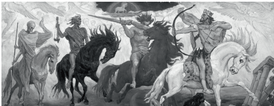
Die apokalyptischen Reiter. Gemälde von Viktor Wasnezow

“Die letzten Dinge” Oratorium nach Worten der Heiligen Schrift op. 62 für Soli, Chor und Orchester