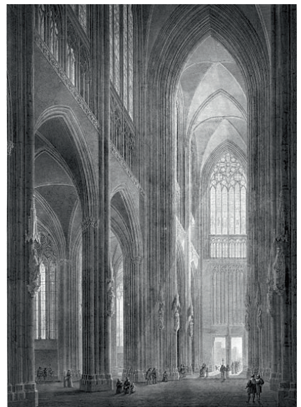
Kölner Dom: Innenansicht des um 1850 bereits existierenden westlichen Teil des Haupthauses. Zeichnung von Sulpiz Boisserée. Max Hasak, aus "Der Dom zu Köln", 1911 (wikimedia commons)

Der vierte Satz überrascht gleich dreimal: zunächst, weil man an dieser Stelle das übliche, schnelle Finale erwartet. Dann überrascht dieser Satz wegen der neuen Klangfarben. Die nun führenden Posaunen haben bisher geschwiegen. Und drittens überrascht der sakrale Charakter. Was wir hier hören, ist eigentlich Kirchenmusik. Wasielewski nennt uns den Hintergrund: "Während der Komposition wurde der Meister durch die, in jene Zeit fallenden, zur Kardinalserhebung des Kölner Erzbischofs v. Geissel stattfindenden Feierlichkeiten beeinflusst". Diesem Umstand verdankt die Symphonie wohl diesen in formeller Hinsicht ungewöhnlichen Satz, ursprünglich überschrieben "Im Charakter der Begleitung einer feierlichen Zeremonie". Dass Schumann hierfür Posaunen einsetzt, entspricht einer alten Tradition für die Kirchenmusik. Man meint gleich zu Beginn in den Kontrabässen und der Bassposaune eine feierliche Prozession zu hören, die gemessenen Schrittes durch die Kathedrale schreitet. Darüber liegt wie ein Gesang von Priestern und Mönchen der Klang der übrigen Posaunen und der Hörner. Schumann führt sie bis in extrem hohe Lagen. Die Musik lenkt so den "Blick" des Zuhörers an den riesigen Säulen des Domes entlang nach oben bis unter das