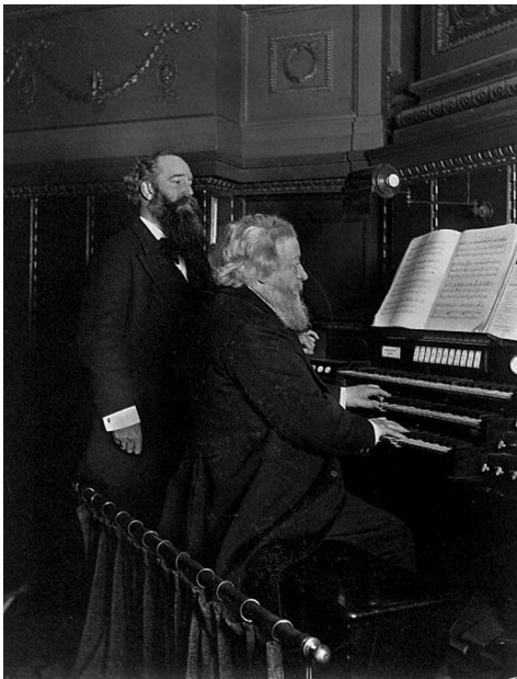
Ernest Hergt: Alexandre Guilmant (an der Orgel) und Clarence Eddy in der Steinway Hall, Chicago, 1898

Guilmants erste Sinfonie für Orgel und Orchester op. 42 basiert auf seiner ersten Orgelsonate mit der gleichen Opuszahl, die 1874 entstand. Vier Jahre später überarbeitete Guilmant die Sonate und fügte ihr einen Orchester-Part hinzu. Die Orgelsinfonie zeigt eindrücklich, wie Guilmant für seine Zeit ungewöhnlich Orgel und Orchester miteinander verbindet. Es gelingt ihm, die Orgel gleichsam als weitere „Instrumentengruppe“ in das Sinfonieorchester zu integrieren, ohne dabei die Orchesterinstrumente in ihrer Rolle zu duplizieren. Dass dies nicht so einfach ist, zeigen andere Werke für Orgel und Orchester, die deshalb beispielsweise zugunsten der Orgel auf die Besetzung von Bläsern im Orchester verzichten. In Guilmants erster Sinfonie nimmt die Orgel also nicht nur die Rolle einer „dritten Kraft“ neben Streichern und Bläsern ein, sondern ist auch ein solistisch-konzertant agierendes Gegenüber zum Orchester. Diese Sinfonie dokumentiert in ihrer überaus wirkungsvollen Fassung eindrucksvoll das Streben des späten 19. Jahrhunderts nach musikalischer Monumentalität.