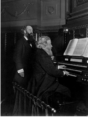
Alexandre Guilmant (an der Orgel) und Clarence Eddy in der Steinway Hall, Chicago, 1898

Guilmants erste Sinfonie für Orgel und Orchester op. 42 basiert auf seiner ersten Orgelsonate mit der gleichen Opuszahl, die 1874 entstand. Vier Jahre später überarbeitete Guilmant die Sonate und fügte ihr einen Orchester-Part hinzu. Die Orgelsinfonie zeigt eindrücklich, wie Guilmant für seine Zeit ungewöhnlich Orgel und Orchester miteinander verbindet. Es gelingt ihm, die Orgel gleichsam als weitere „Instrumentengruppe“ in das Sinfonieorchester zu integrieren, ohne dabei die Orchesterinstrumente in ihrer Rolle zu duplizieren. Dass dies nicht so einfach ist, zeigen andere Werke für Orgel und Orchester, die deshalb beispielsweise zugunsten der Orgel auf die Besetzung von Bläsern im Orchester verzichten. In Guilmants erster Sinfonie nimmt die Orgel also nicht nur die Rolle einer „dritten Kraft“ neben Streichern und Bläsern ein, sondern ist auch ein solistisch-konzertant agierendes Gegen-