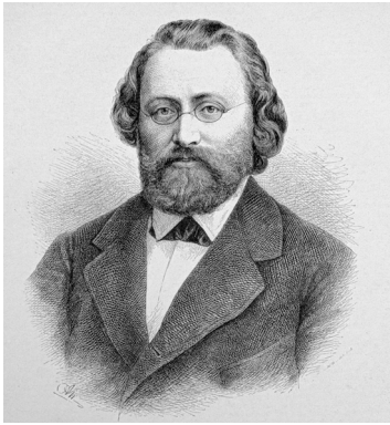
Bild aus Seite 557 in „Die Gartenlaube“, Leipzig 1881

Max Bruch ist einer jener Musiker und Komponisten des 19. Jahrhunderts, die im Laufe der Zeit zu Unrecht ins Abseits gerieten. Bruch ist heute in der Hauptsache für sein erstes Violinkonzert bekannt, dem genialen Wurf seiner ersten Schaffensperiode. Die Popularität seines ersten Violinkonzertes hat ihn jedoch an den Rand der Verzweiflung gebracht. „Ich kann dieses Concert nicht mehr hören“, schrieb er seinem Verleger. Es stand auch dem restlichen Schaffen des Komponisten stets im Wege. Überdies stand Bruch zu seinem großen Leidwesen zeitlebens im Schatten seines Freundes, des übermächtigen Johannes Brahms, mit dem er sich stets vergleichen lassen musste.